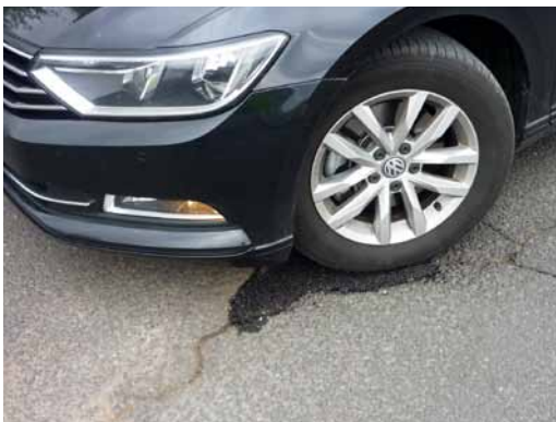
Das eingebaute BÖRNER Rephalt ist sofort belastbar

*Bei größeren Schichtdicken lagenweiser Einbau.